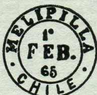
Tipo F. 55