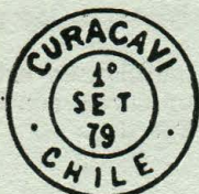
Tipo H. 57