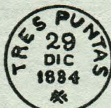
Tipo J. 58