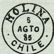
Tipo G. 56