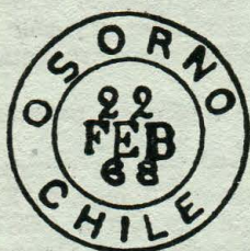
Tipo E. 54